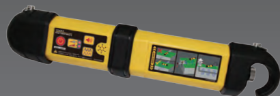
Генератор 1 Вт