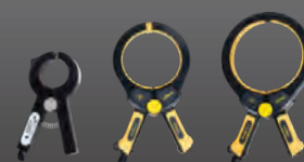
Клещи Ø 50, 100, 125 мм

Эксклюзивный дистрибьютор «Vivax-Metrotech» на территории РФ ООО "СЕБА ИНЖИНИРИНГ" г. Москва, 2-й Кожуховский проезд, д.29, к.2, стр.2, офис 402, этаж 4М www.sebaeng.ru | vivax@sebaeng.ru | +7 (499) 683-02-50