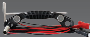
Соединительные провода и штырь