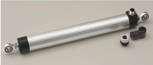
Линейный датчик, LWG 225