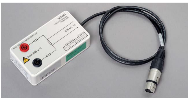
Делитель напряжения, VD401