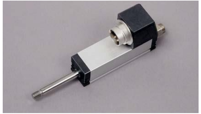
Линейный датчик, TS 25