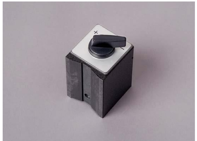
Включаемое магнитное основание