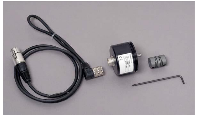
Угловой датчик, Novotechnic IP6501 (аналоговый)