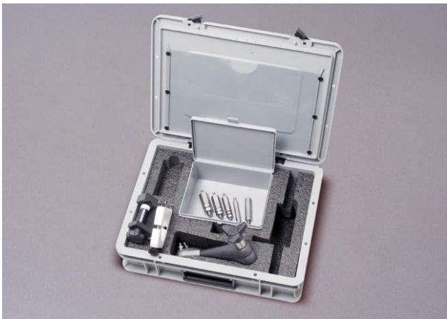
Набор для монтажа угловых датчиков