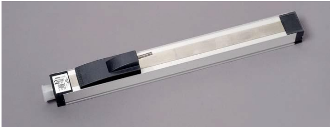
Линейный датчик, TLH 225